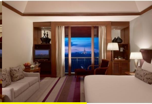
หรือ นำท่านเข้าสู่ที่พัก**โรงแรมหรูระดับ 5 ดาว Sule Shangri-La Yangon Hotel 5*